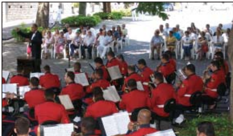
Os visitantes da ADESG -JF durante a apresentação da Banda Sinfônica do Corpo de Fuzileiros Navais

Houve a apresentação das Bandas Sinfônica e Marcial, além de visita ao circuito histórico e cultural do Museu do Corpo de Fuzileiros Navais.